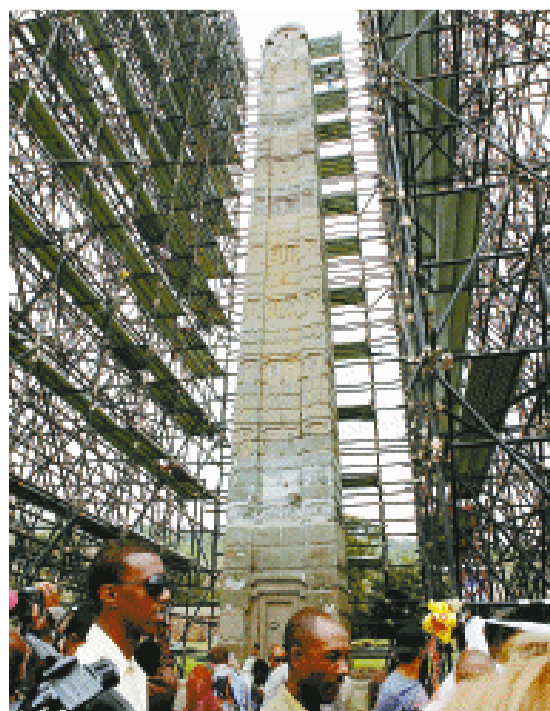
9月4日,数千名埃塞俄比亚各界人士聚集在阿克苏姆古城,欢庆由意大利归还的国宝阿克苏姆方尖碑归位亮相。阿克苏姆方尖碑由花岗岩构成,高24米,重达150多吨,至今已有1700年历史。

台“调查局”前局长叶盛茂涉嫌隐匿陈水扁家族海外洗钱的公文,已被台湾检方以“隐匿公文罪”起诉,并求处2年6个月有期徒刑。叶盛茂2日下午突然召开记者会对外承认,在2006年底和2008年初曾接获国际防洗钱组织提供的2项有关扁家疑似海外洗钱的公文,他都在第一时间呈报给了陈水扁,而他8月15日询问相关公文去向,陈水扁称“找不到了”。陈水扁办公室随后以声明稿形式称,“只是看过一些情资报告,没有看到什么公文不公文”,也“没有说过公文找不到”。