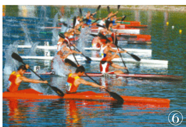
④放飞梦想 ⑤球的引力 ⑥离弦之箭 ⑦奋勇争先 ⑧力掷千钧 ⑨挥拍击球