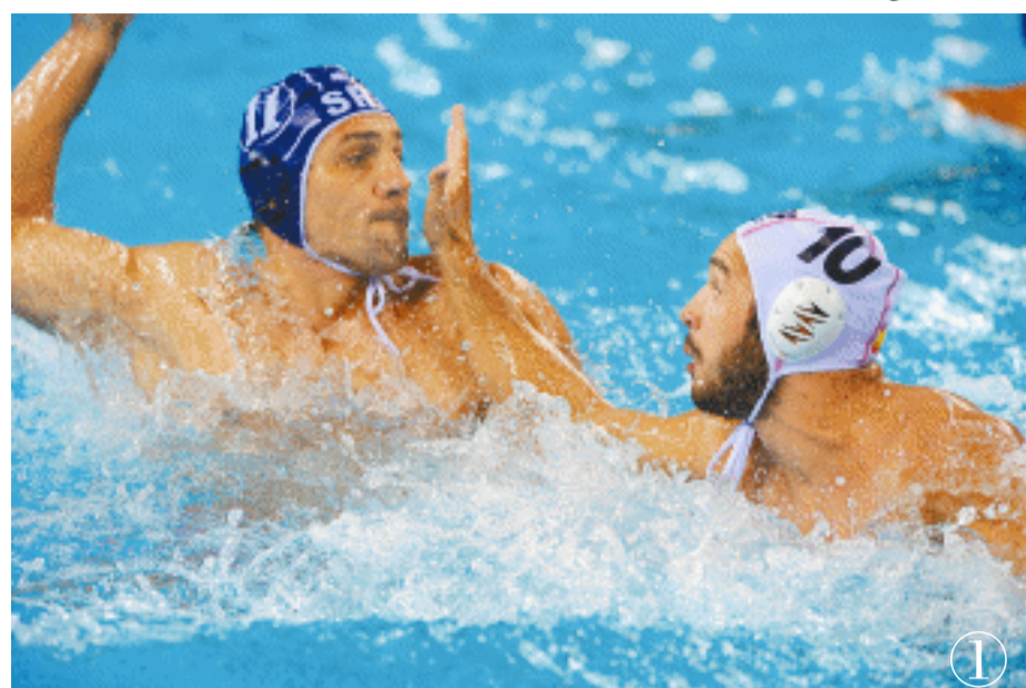
①急中生智 ②离心韵律 ③策马跨越