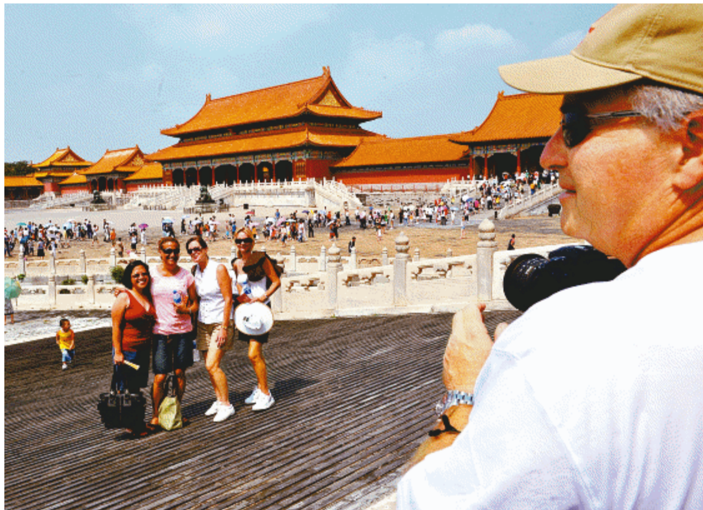
北京奥运会期间,众多外国游客来到北京故宫参观游览,了解和感受中国文化。