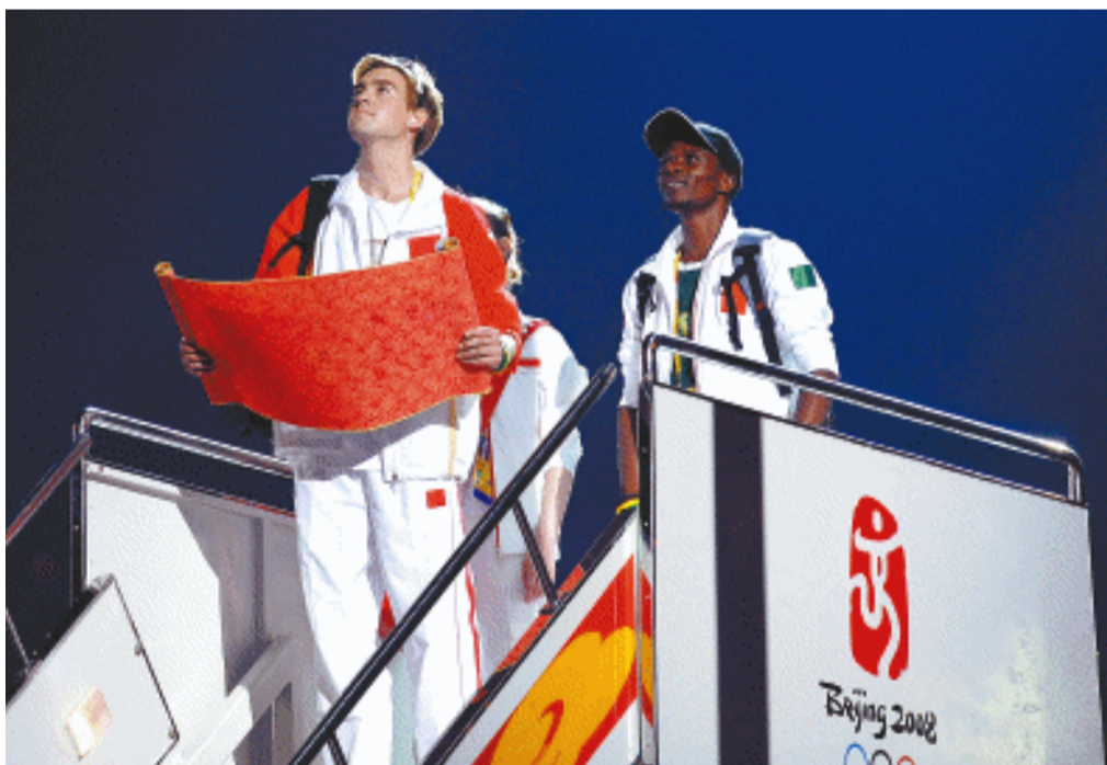
8月24日，闭幕式现场。几名外国运动员以卷起中国画卷的方式，将8月8日点燃的主火炬塔上的圣火慢慢熄灭。

随着场地中心地坑里一个巨大的机械装置“记忆之塔”缓缓升起，两名“运动雕塑”表演者站在“塔”顶，在空中缓慢展现着各种运动造型，向人们传递着崇高的奥林匹克精神。在动人的北京奥运会主题歌声