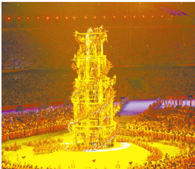
“圣火”表演者攀上“记忆之塔”。