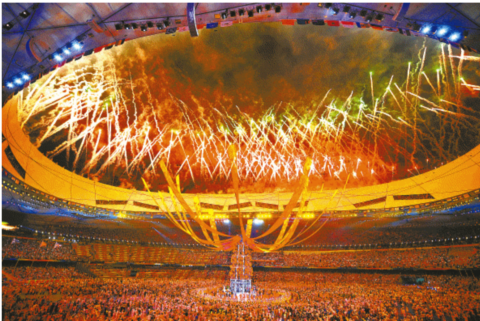
闭幕式上燃放的焰火。