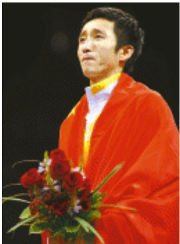
邹市明获拳击男子48公斤级金牌