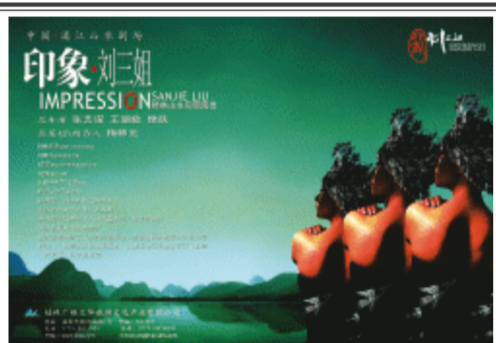
阳朔以敢为人先的气魄，创建了全球首个山水实景剧场印象·刘三姐，该演出—举成名，获得国家首批文化产业示范基地、第三届中国十大演出盛事奖等荣誉。世界旅游组织总干事弗朗切斯科·弗兰基阿利观看演出后评价说：“这是从未见过的演出，从地球上任何地方买张机票飞来看再飞回去都值得。”