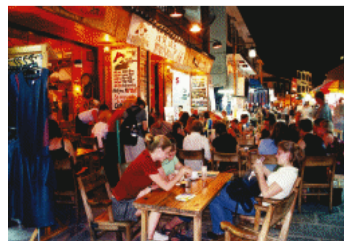
▲阳朔西街以中西合璧的独特风情，获得“洋人街”、“地球村”的美誉，成为中国最大的外语角。