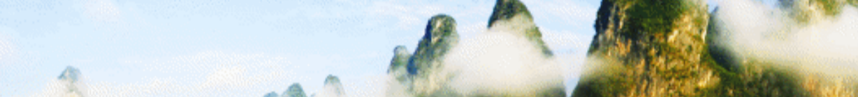
烟雨漓江