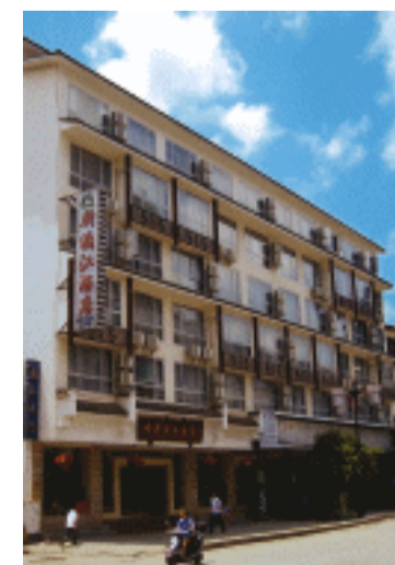
▲阳朔旅游火爆，四、五星级大酒店提升了阳朔旅游接待水平和服务质量。图为新漓江酒店。