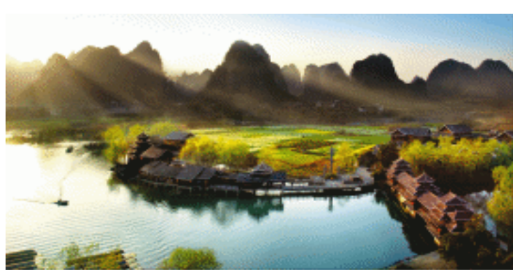
▲被誉为“梦中的香格里拉”的阳朔世外桃源景区，神奇地再现了晋代诗人陶渊明笔下的世外桃源。