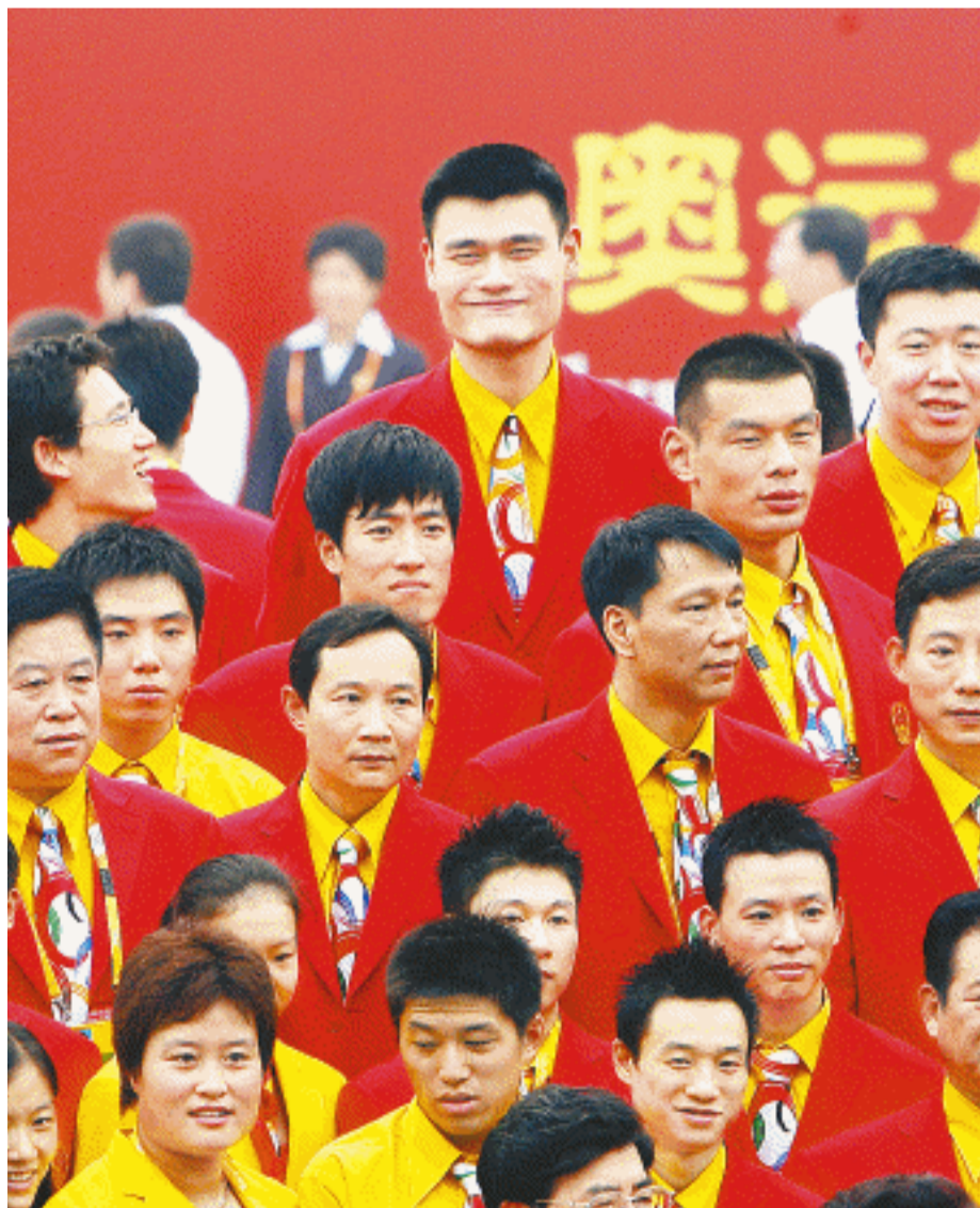
7月27日，2008年北京奥运会奥运村正式开村，参加北京奥运会的中国体育代表团部分成员正式入住奥运村。奥运村将接待来自200余个国家和地区的16000余名运动员和随队官员。