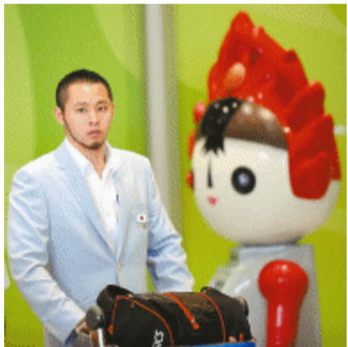
7月27日，参加北京奥运会的日本游泳队25名队员抵达北京。图为日本“蛙王”北岛康介。

谈到对奥运村的感觉，李小鹏表示，总体感觉还是一个美，这是他参加的第三届奥运会，也是到过的第三个奥运村，觉得这里是最好的一个。绿草、蓝天、鲜艳的五星红旗，整齐、干净、有序的管理，给我们和各国的运动员提供了一个极佳的休息环境。