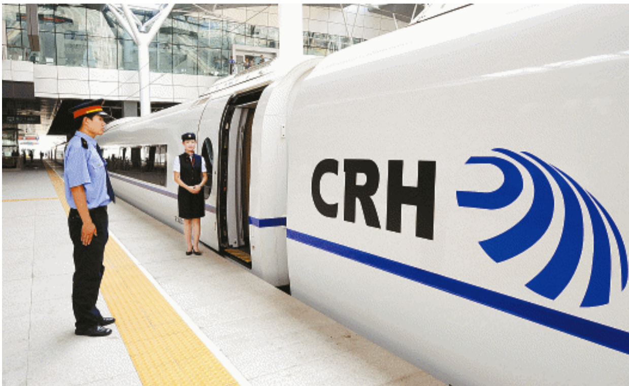
为确保京津城际轨道交通和天津新客站8月1日通车运营，天津新客站售票、进出检票、安检等系统7月22日进入模拟运营状态。同时，京津城际列车已进入试运行的最后阶段。即将正式运营的京津城际铁路连接北京、天津两个直辖市，全长120公里。图为：试运行的CRH3型动车组列车停靠在天津新客站站台。

经济增长的质量和效益进一步提高。上半年，全国财政收入增长30%以上。1-5月规模以上工业企业