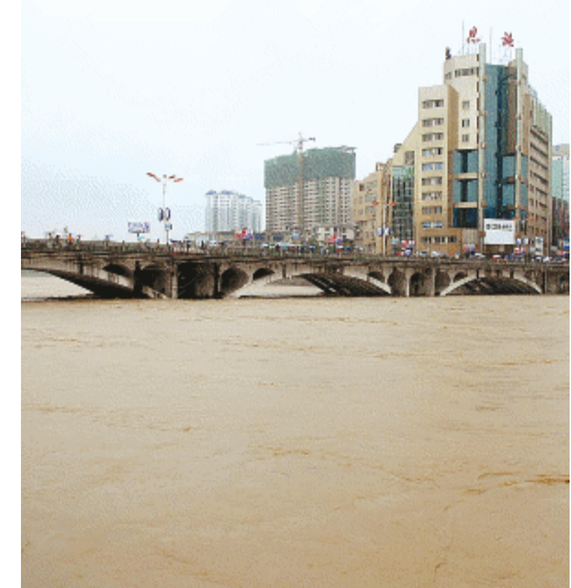
自7月21日开始，湖北恩施出现大范围强降雨天气，恩施市城区清江水位已超过警戒线。灾情发生后，恩施州有关部门迅速组织人员抗洪抢险，紧急转移安置受灾群众。

发展改革委和财政部最近已发文，委托各省、自治区、直辖市的价格主管部门会同财政部门共同制定收费标准，要求按照补偿成本的原则来制定收费标准。按规定，收费标准制定后将通过各种媒体等进行公示。