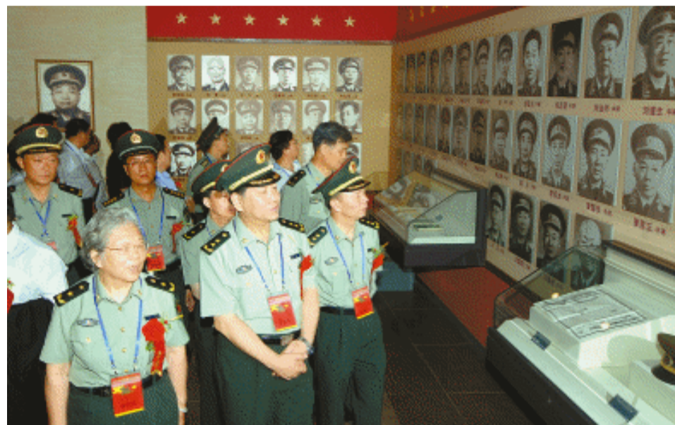
7月22日,纪念平江起义80周年座谈会在平江县隆重举行。图为与会人员在新落成的平江起义纪念馆内参观革命历史图片和文物。

本报7月22日讯(记者 徐亚平 通讯员 平原 旦钦 徐恩 北临) 今天,纪念平江起义80周年座谈会在平江县隆重举行。