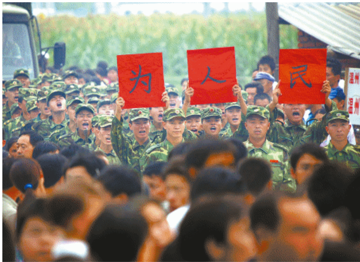
7月20日,在重灾区青川参与抗震救灾的济南军区某“猛虎师”官兵撤离归建。长长的送别队伍,站满了道路两旁;短短的一公里,撤离的车队走了三个小时。图为青川县木鱼镇的乡亲们在这送别抗震救灾官兵。

新华社北京7月20日电 中央军委主席胡锦涛日前签发《组织抗震救灾部队分期分批回撤》命令,明确在安排足够兵力确保圆满完成抗震救灾任务的前提下,按照“统筹安排、保障需要、区分缓急、分期分批”的要求,有计划组织部队分期分批回撤。根据中央军委命令,第一批部队将于7月21日起组织回撤,其余部队待完成任务后陆续回撤归建。