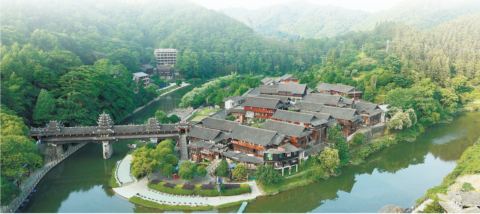
6月7日，通道侗族自治县皇都侗文化村半岛上的新寨。