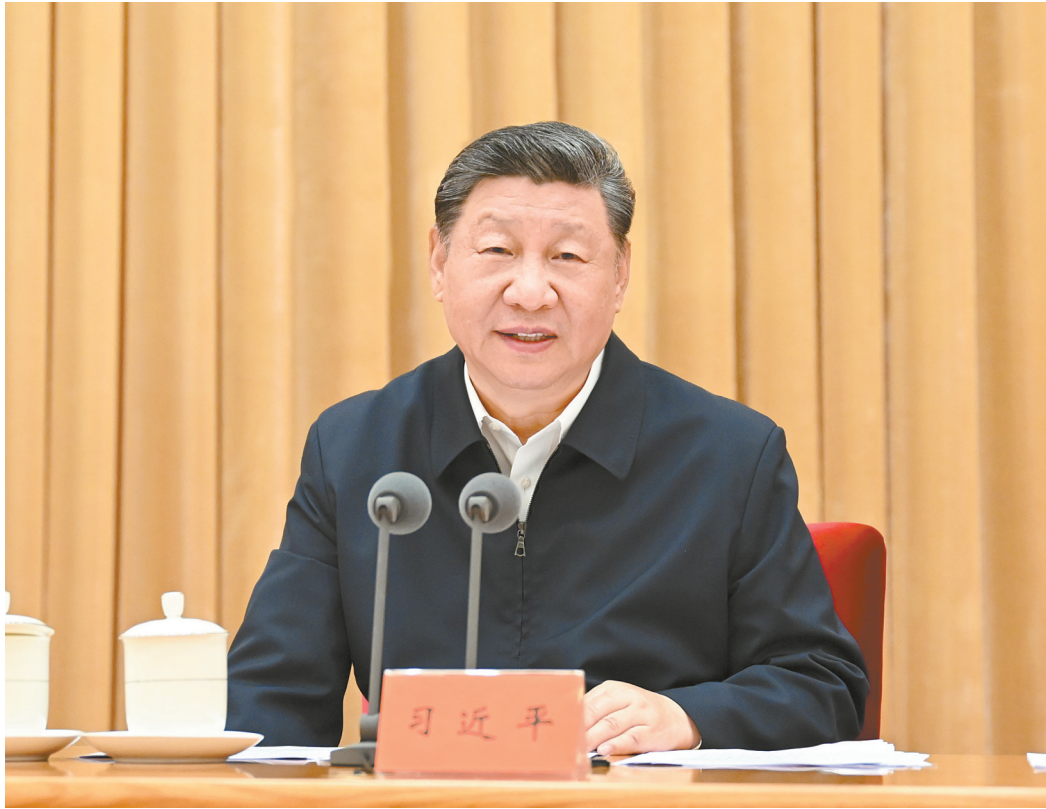
7月14日至15日，中央城市工作会议在北京举行。中共中央总书记、国家主席、中央军委主席习近平出席会议并发表重要讲话。

新华社北京7月15日电 中央城市工作会议7月14日至15日在北京举行。中共中央总书记、国家主席、中央军委主席习近平出席会议并发表重要讲话。中共中央政治局常委李强、赵乐际、王沪宁、蔡奇、丁薛祥、李希出席会议。