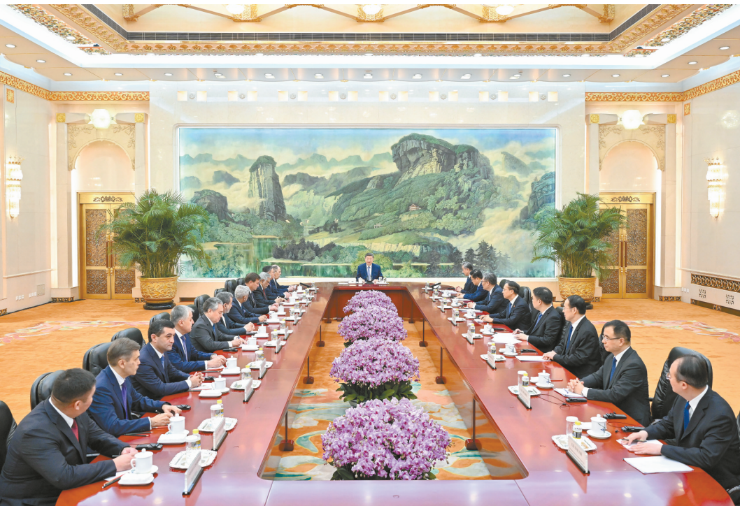
七月十五日上午，国家主席习近平在北京人民大会堂集体会见来华出席上海合作组织成员国外长理事会会议的各国外长和常设机构负责人。

新华社北京7月15日电 7月15日上午，国家主席习近平在北京人民大会堂集体会见来华出席上海合作组织成员国外长理事会会议的各国外长和常设机构负责人。