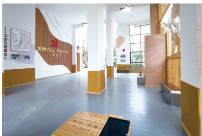
天心区黑石铺街道怡和山庄小区的党群服务站——邻里会客厅。