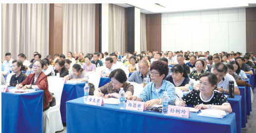
5月26日,天心区327名小区党组织书记参加系统轮训班。