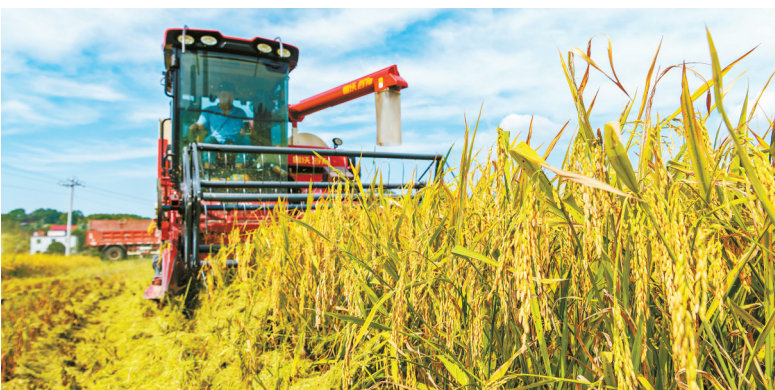
7月12日,安乡县芦洪市镇西江桥村,农民操作机械收割早稻。