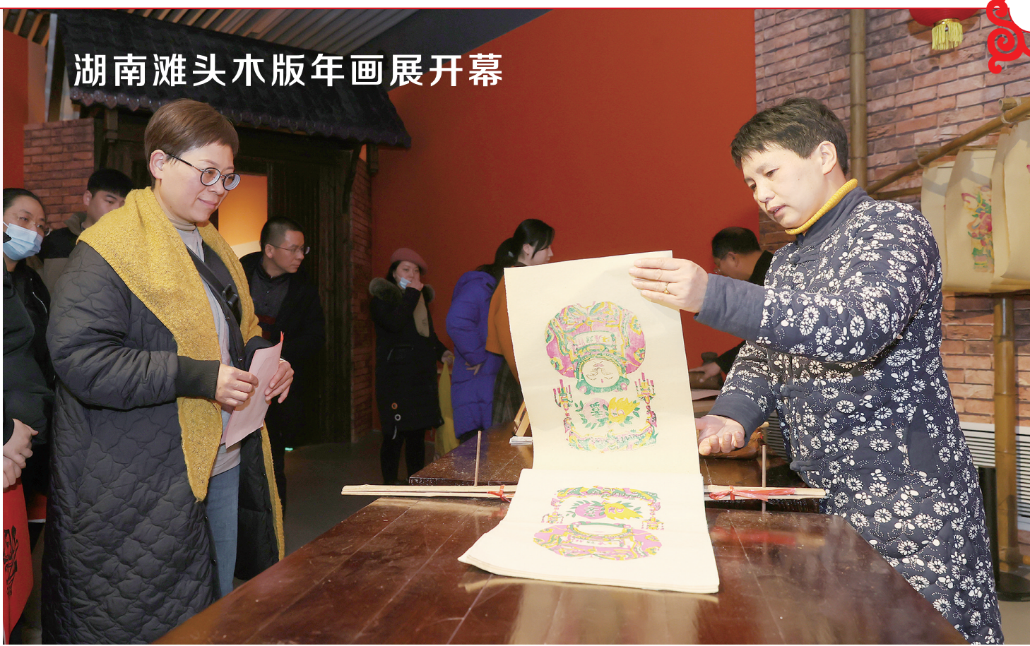
湖南滩头木版年画展开幕

经营主体快速增长,企业活力持续激发,全县茶叶、黄精、文印、电子陶瓷等产业稳健发展,有力带动了创业就业,解决各类就业岗位10多万个。