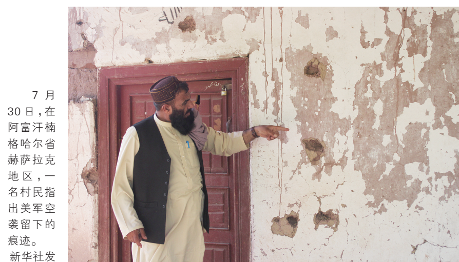
7月30日,在阿富汗楠格哈尔省赫拉克地区,一名村民指出美军空袭留下的痕迹。

在阿富汗东部楠格哈尔省大山深处的赫拉克地区,倒塌多年的房屋废墟和残垣上大大小小的弹坑无言地讲述着战争的历史……距2021年8月30日美军撤离阿富汗即将满两年之际,新华社记者重返曾多次遭到美军空袭的赫拉克,对当地很多人来说,美军在这里犯下的暴行历历在目。