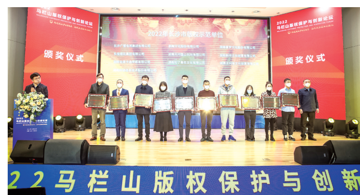
2022 年 12 月 20 日马栏山版权保护与创新论坛颁奖仪式。