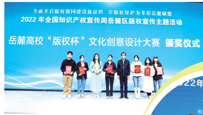
2022 年全国知识产权宣传周岳麓区版权宣传主题活动现场。