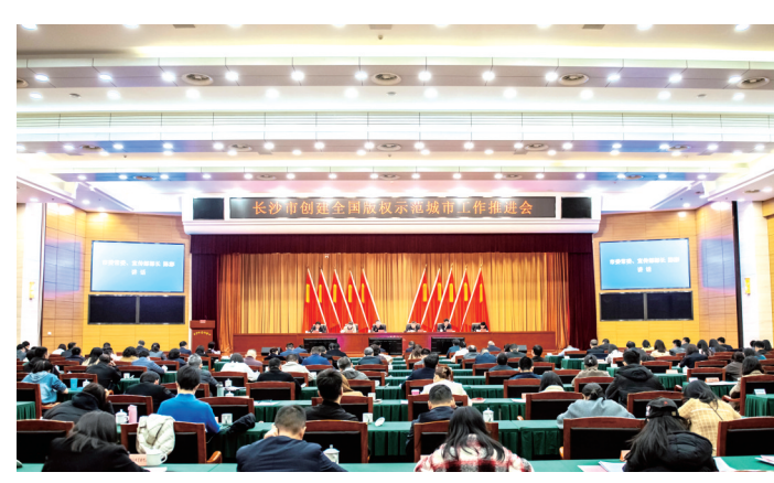
2023 年 4 月 25 日，长沙市召开全市创建全国版权示范城市工作推进会。

点。为更好地服务创作者和企业，提升版权服务水平，2019 年 12 月，长沙成立马栏山版权服务中心，运用区块链技术打造了“优版权”服务平台，为民众和企业提供版权确权、登记、监测、维权、金融等一站式服务。 “以图片版权作品为例，中心除了确权登记，帮助权利人拿到作品‘身份证’以外，我们还可以监测它的网络使用量，以便及时发现版权侵权行为。”长沙市版权协会秘书长、马栏山版权服务中心主任何非常介绍，中心还与公证机构联合开发了“公正保”APP，权利人可利用它固定证据，方便自身维权。 此外，长沙还培育壮大了“优版权”服务平台，可一站式提供版权登记、存证、监测、质押、侵权取证、维权、交易、衍生品开发等全链条服务。截至 2022 年底，平台已完成全国范围内的作品区块链版权存证数超 101 万件，版权侵权监测量达 5 万多条，侵权取证量超 4 万件，平台累计监测到李某某的视频侵权线索 200 多万条，通过中介调解权利人获赠 600 多万元。