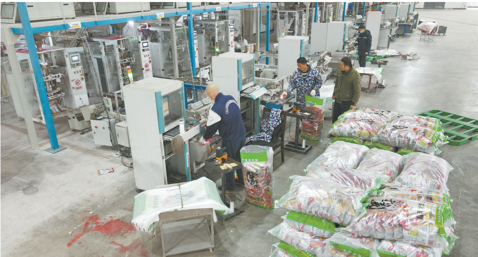
2月8日，益阳市隆平高科益阳种业产业园，工作人员在生产品两优华占、冠两优华占等市场畅销品种。目前，该公司已生产加工种子1300多万公斤，陆续出库到全国各县级网点，为春耕生产备好种子。

新邵县农业农村局党组书记、局长谭中凡介绍，目前该县已组织干部、技术人员下乡300余人（次），培训200余名机械维修保养人员，累计检修和保养各类农机具1.68万台；全县新增农业机械2000余台，15家农机大户、农机合作社突破“百万农机”，水稻机插机抛秧作业面服务面积可达3.2万亩。