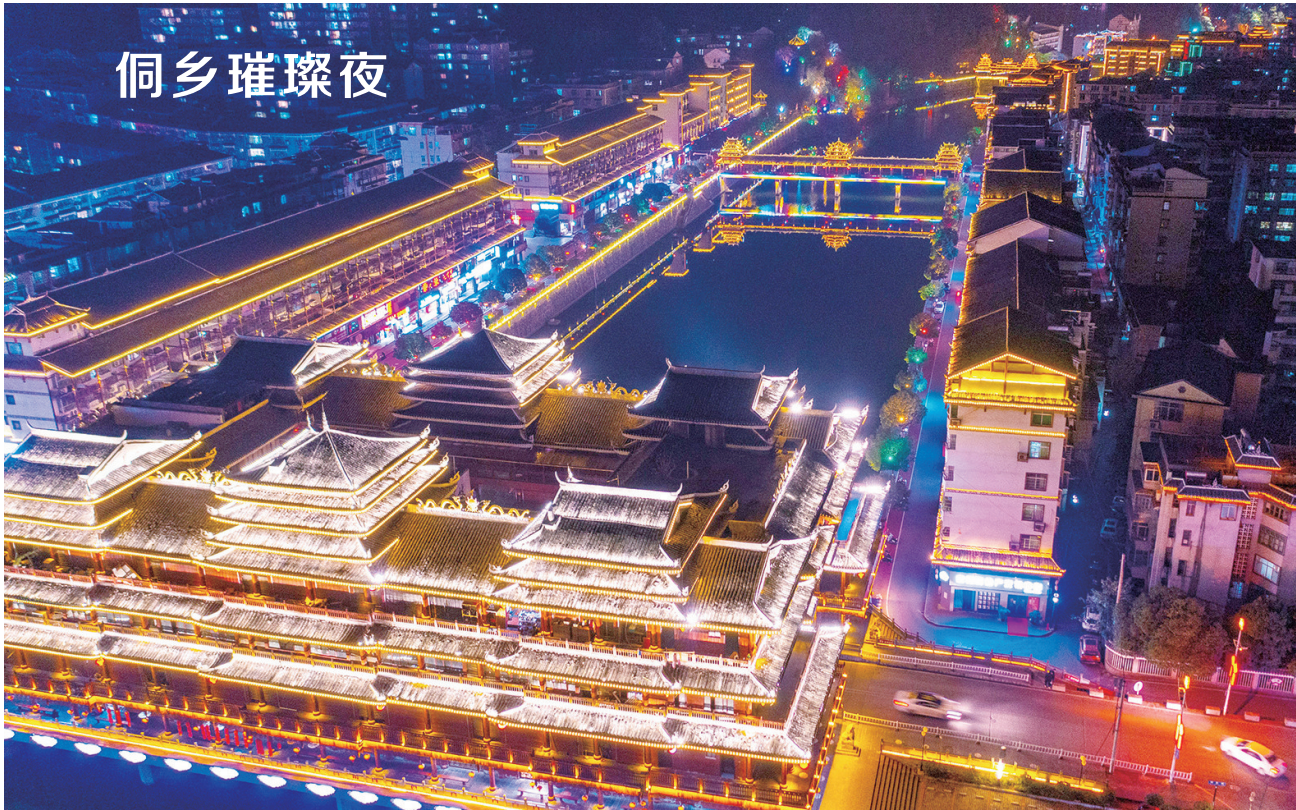
12月21日晚,通道侗族自治县沿河风光带灯光璀璨,魅力无限。近年,该县以创建全国文明城市为抓手,着力改善城乡人居环境,提升群众生活质量,让发展成果更多、更好地惠及民生。

衡阳市委副书记、耒阳市委书记赖馨正介绍,这些项目将为蔡伦故里风景名胜区创建国家5A级景区注入新动能。耒阳旅游资源丰富,是发明家蔡伦探索、传播造纸术的根据地。蔡伦竹海现为国家4A级旅游景区,规划面积106平方公里,竹林面积达16万亩,素有“亚洲大竹海”“天然大氧吧”之称。蔡伦竹海有著名的“竹海三绝”,分别是世界第一高的天然喷泉——大河滩喷泉、距今2.5亿年的古鱼化石、以共生晶簇享誉世界的上堡晶矿。