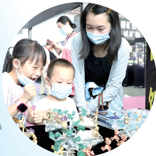
家长带着孩子参观矿晶工艺品。何庆辉 摄