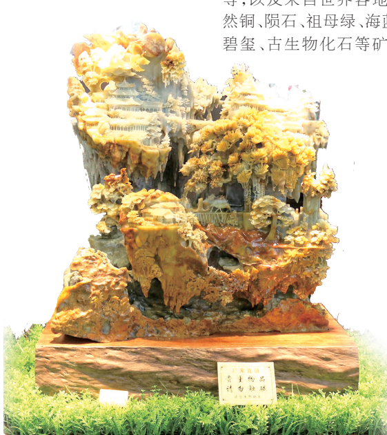
精雕玉琢的参展作品。