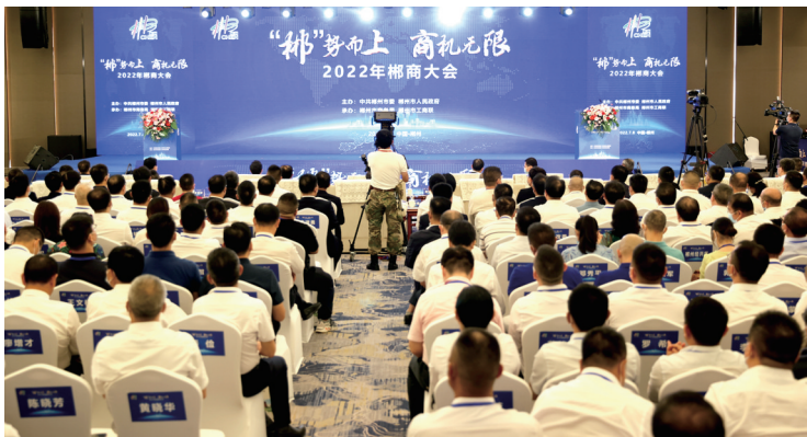
7月8日下午,2022年郴商大会在郴州开幕。