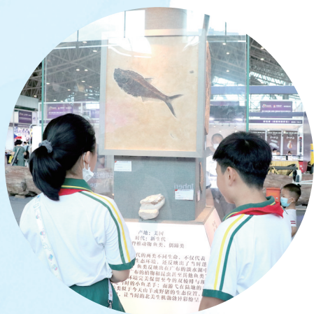
小学生在参观化石标本。

十届矿博会,十年真“晶”彩。矿博会举办十年来,郴州以石为媒,以石会友,实现了从政府向市场转型,从名片到名牌的蜕变,从展会到节会的转变,展会规模年年攀升,签约金额屡创新高,已成为世界了解郴州的窗口,郴州走向世界的桥梁。