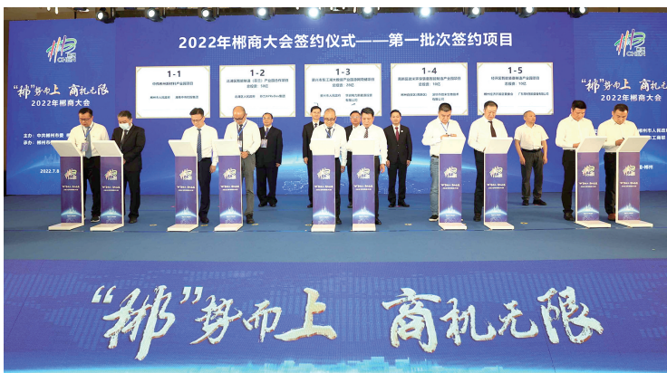
本次郴商大会活动期间共签约项目34个,总投资610.76亿元。