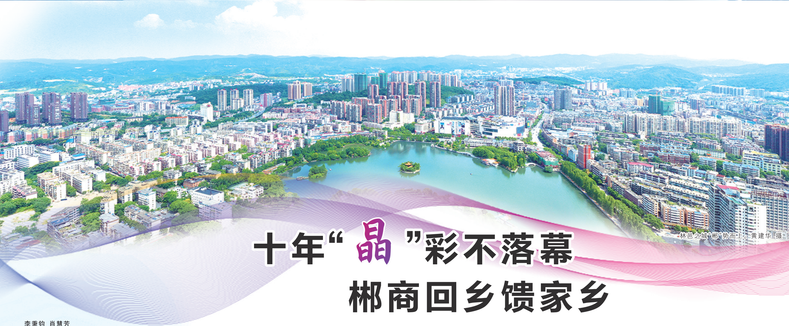
林邑之城“郴”势而上。