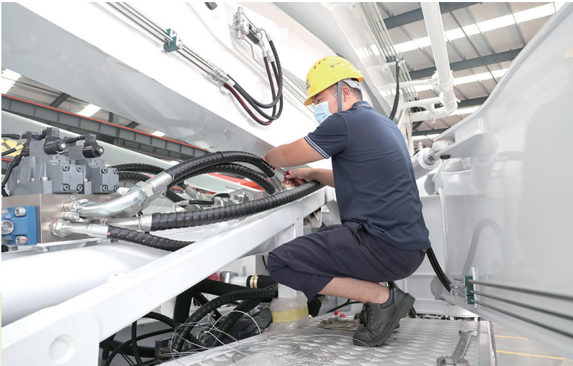
常德高新区响箭重工坚持“人才是第一力量”的理念，聚才育才，得以跻身于国家级小巨人企业之列。

“针对装备制造业，补贴对象降低了门槛，对新引进的全日制专科生及从事技能岗位的中级工，给予工作和生活补贴500元/月……”近日，常德市经开区相关部门的工作人员，深入辖区企业宣传4月22日“新鲜出炉”的两个文件