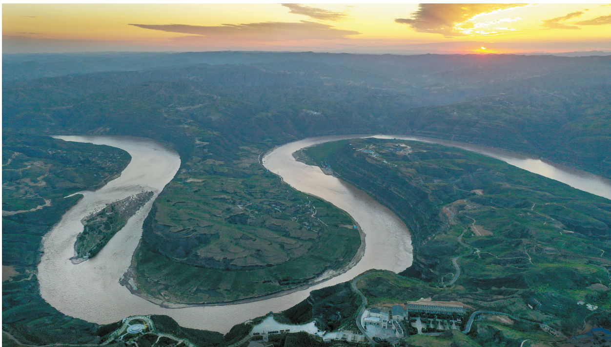
朝霞下的黄河乾坤湾(2019年8月14日摄，无人机照片)。

“尽管这样，用水效率仍然不高。西北农村曾经普遍打水窖，水是家家户户的命根子，洗完脸洗完菜还要接着用。”结合亲身经历，总书记接着说，“我们那会儿在陕北用水，水舀出来，先舀一缸子准备刷牙，然后洗头洗脸再洗脚。现在随着生活水平的提高，打开水龙头就是哗哗的水，在一些西部地区也是这样，人们的节水意识慢慢淡化了。水安全是生存的基础性问题，