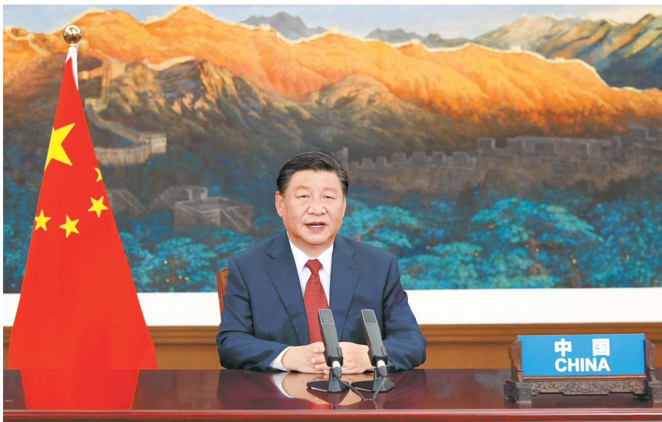
9月21日,国家主席习近平在北京以视频方式出席第七十六届联合国大会一般性辩论并发表题为《坚定信心 共克时艰 共建更加美好的世界》的重要讲话。

和促进人权,做到发展为了人民、发展依靠人民、发展成果由人民共享,不断增强民众的幸福感、获得感、安全感,实现人的全面发展。