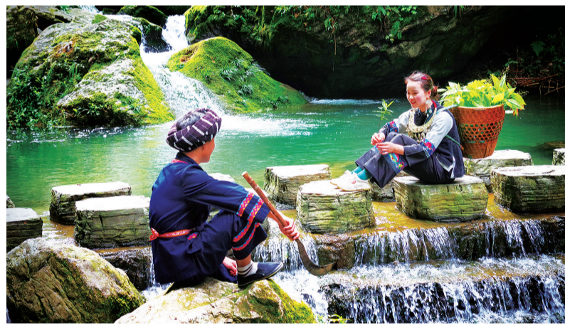
德夯大峡谷里，苗族风情浓郁的边边场。