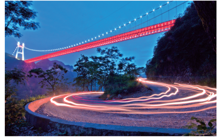
矮寨盘山彩虹公路与矮寨大桥，在夜色里，交相辉映。