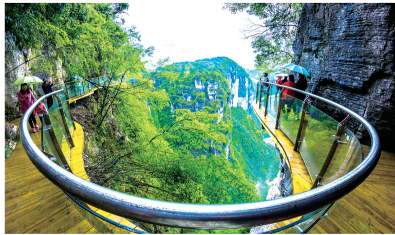
德夯大峡谷上的玻璃栈道。