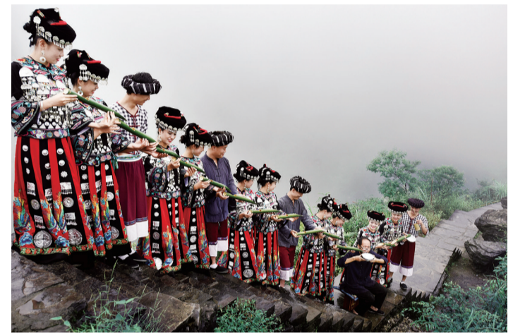
苗家人独特的敬酒方式——高山流水。

百万脱贫，今古奇观。高速网织，桥接洞连。矮寨飞虹，路挂云端。十年生聚，林木翳天。万山回春，葱茏重现。天人谐和，地净气爽。游人如织，流连忘返。蓬蓬勃勃，湘西兴哉！