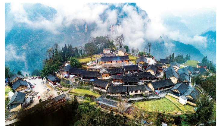
十八洞梨子寨远眺。