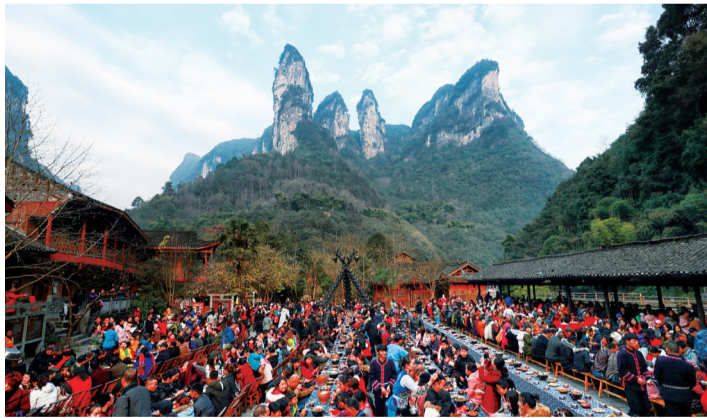
游客在德夯苗寨里品尝苗家长龙宴。