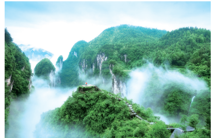
德夯大峡谷中的天万台。