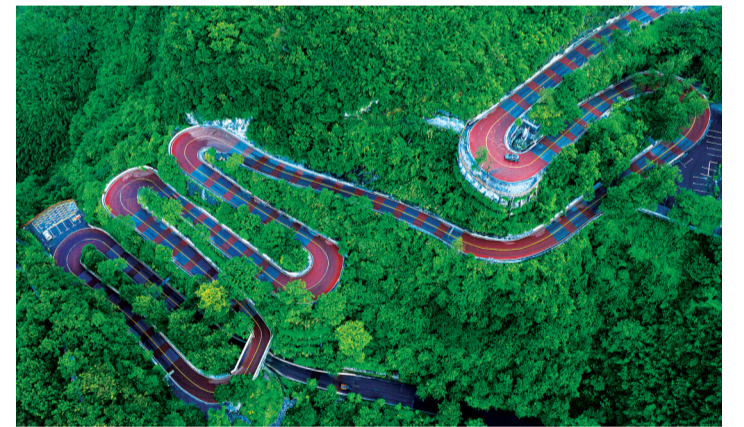
矮寨盘山彩虹公路。