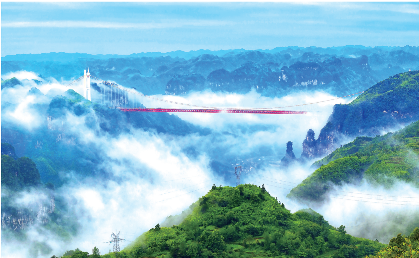
峡谷之巅，云雾缭绕，矮寨大桥异常壮观。