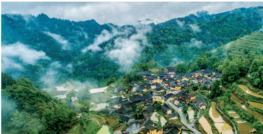
十八洞竹子寨远眺。