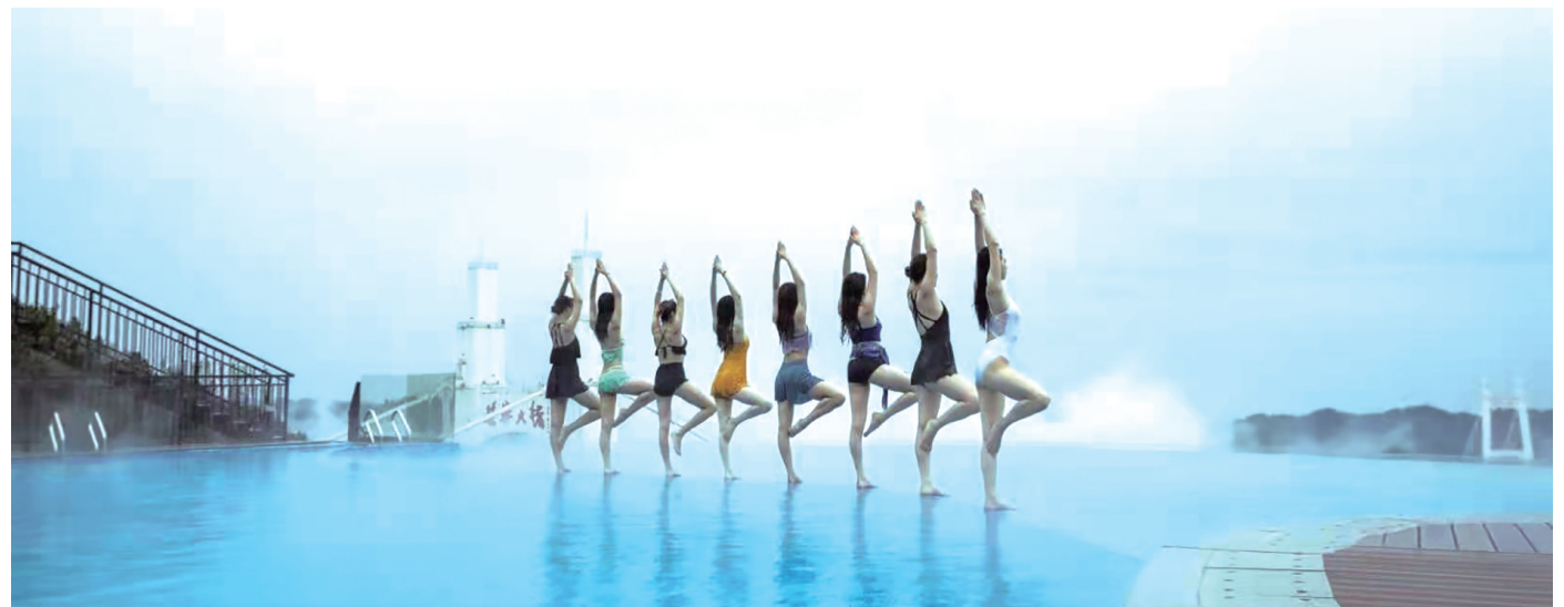
矮寨大桥茶峒岸半山腰——天桥仙居，成为网红打卡地。