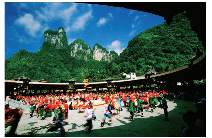
德夯苗寨素有“天下鼓乡”之称。