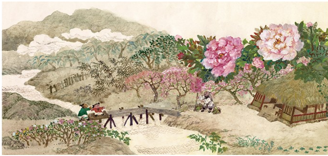
蔡皋绘本《秋翁遇仙记》内页。