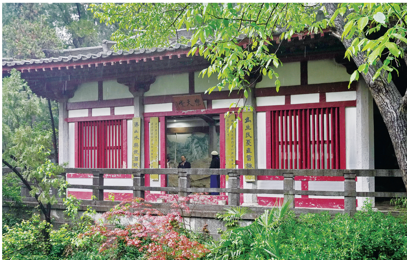
河南省洛阳市龙门石窟香山白园，雨中的乐天堂。