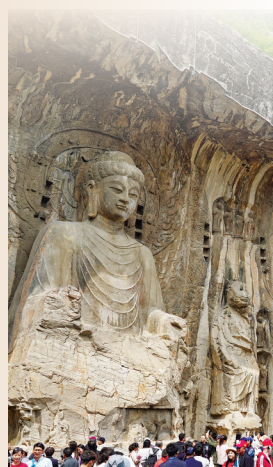
洛阳市伊水河边的龙门石窟游人如织。

力”的智能修复师，能透过重重污垢与复杂纹理，精准捕捉并补充文字笔画的走向与结构，有效抑制修复过程中常见的笔画粘连、虚假纹理等问题，实现了对重度退化秦简文字的高保真复原。 团队还首次构建了高质量的里耶秦简“噪声图”“灰度图”“真实图”三通道配对数据集，一举填补了该领域专用数据集的空白，为简牍文献的智能处理研究提供了关键的数据支撑。 业内专家指出，此项研究成果是人工智能与出土文献保护深度融合的重要突破。它不仅为解决同类文物数字化修复难题开拓了新路径，也为数量庞大、亟待抢救的濒危简牍文献的长期保存与活化利用，提供了切实可行的创新方案。