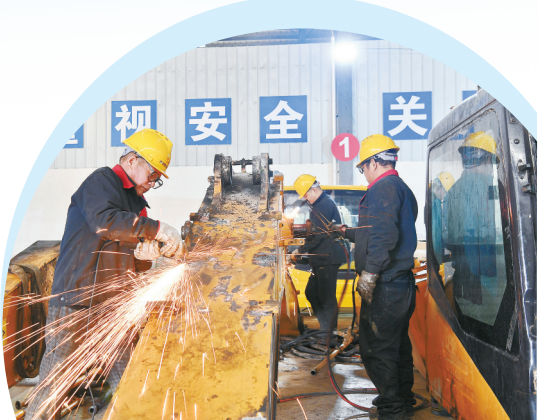
12月4日，位于湘阴县的湖南创锐机械制造有限公司生产车间。

记者离开时，虞公港一声悠长的汽笛划破天空，这笛声，像是进军的号角，为一场绿色产业革命、为一个正在崛起的“再制造新城”鼓劲。