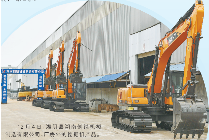
12月4日，湘阴县湖南创锐机械制造有限公司，厂房外的挖掘机产品。

虞公港的物流优势就此凸显：即使是枯水期，也具备5000吨级通航能力。对工程机械这类“大块头”来说，意味着更少的拆装、更低的单次运费。更重要的是，从这里出发，船舶可直接进入长江干线，无需中转，一路直航。