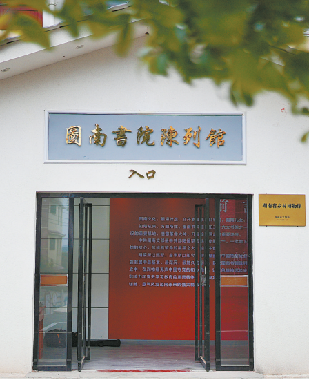
上图：邵阳县诸甲亭乡图南书院陈列馆。左图：图南书院陈列馆一角。