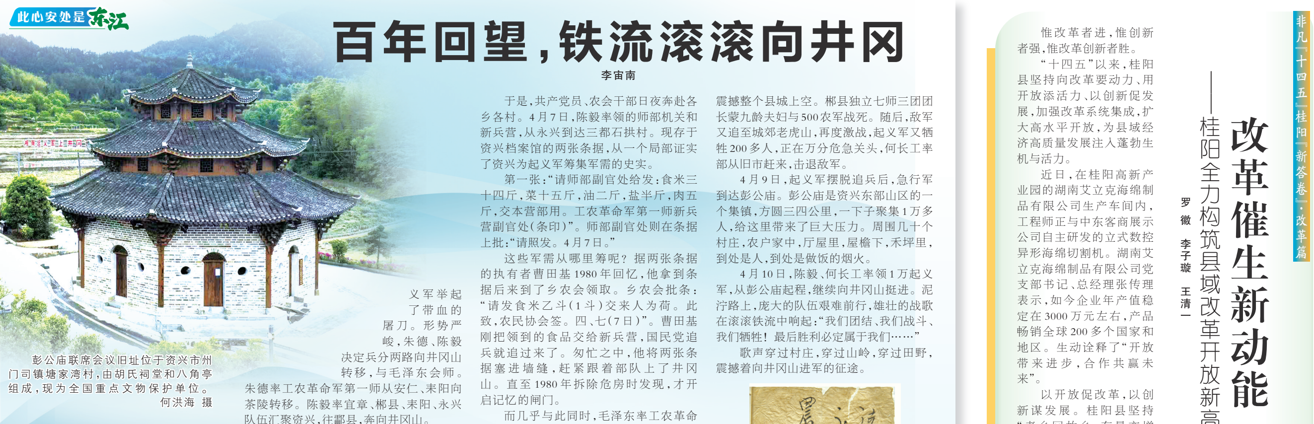
彭公庙联席会议旧址位于资兴市州门司镇塘家湾村，由胡氏祠堂和八角亭组成，现为全国重点文物保护单位。

1928年春，长空一声惊雷，湘南大地卷起红色风暴！朱德、陈毅智取宜章，一声枪响，揭开湘南起义大幕。 红旗一展，万众跟随。两个月内，攻克郴县耒阳，解放永兴资兴。随后，桂阳、安仁、攸县、酃县等21个县，工农齐奋起。同年3月，资兴成立县委，县苏维埃政府，调集3000农民起义军，在郴县、永兴工农军支持下，三打资兴县城，获得全胜。 然而，风云突变。3月中旬，国民党从广东、湖南调集9个师南北夹击，向湘南起