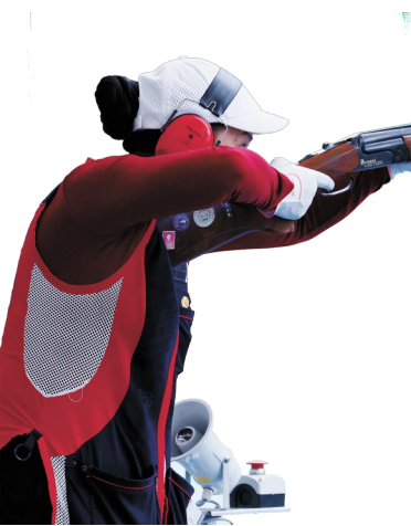
刘英姿在比赛中。

11月24日,长沙阳光明媚。刚刚结束第八次全运之旅的刘英姿暂时放下了枪,穿着一身休闲装,在飞碟训练场看年轻运动员训练。 在刚刚过去的第十五届全运会飞碟多向比赛中,刘英姿虽然在个人赛中没有进入决赛,但在混合团体赛中与队友郭雨浩夺冠,为湖南“金喜”收官。