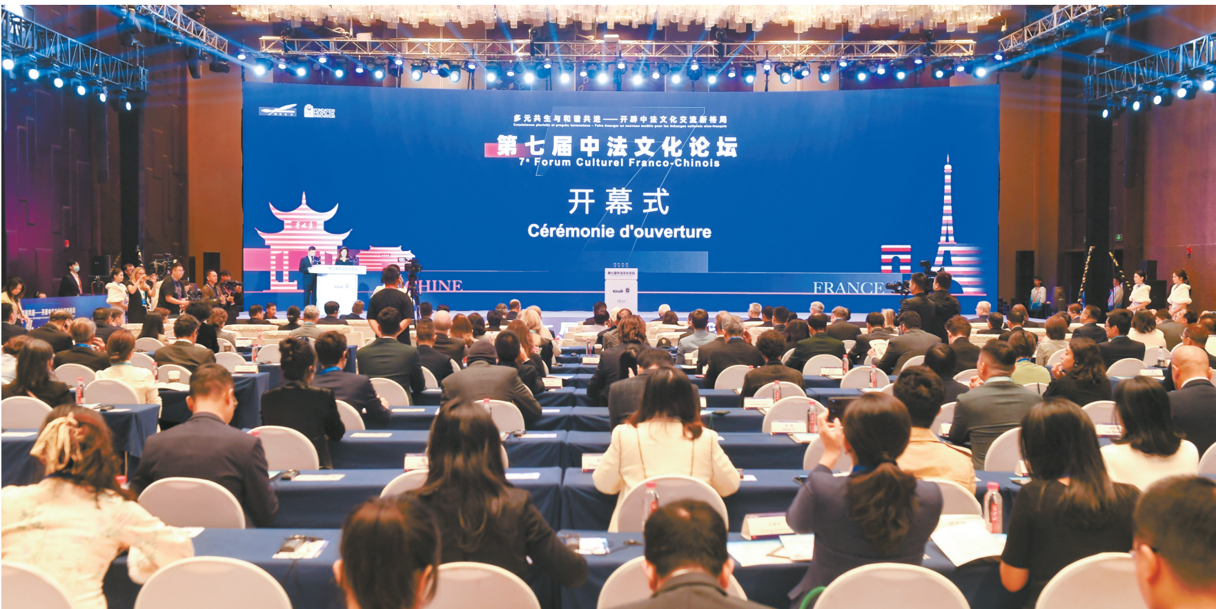
11月3日,第七届中法文化论坛在长沙开幕。图为大会开幕式现场。

本届论坛以“多元共生与和谐共进——开辟中法文化交流新格局”为主题,设置了开幕式、主旨演讲、平行论坛、市长圆桌对话、闭幕式等环节,涵盖文化旅游与城市发展、人工智能与文化创意、艺术教育与人才交流、文博产业与文物保护等领域,旨在进一步促进中法两国文化在多元共生中相互借鉴、和谐共进,推动中法文化交流迈向新高度。