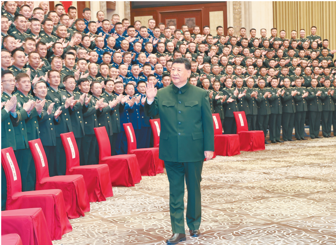
九月二十三日午，中共中央总书记、国家主席、中央军委主席习近平在乌鲁木齐亲切接见驻新疆部队官兵代表，并同大家合影留念。

新华社乌鲁木齐9月23日电 中共中央总书记、国家主席、中央军委主席习近平23日下午接见新疆各族各界代表，代表党中央向新疆各族儿女致以诚挚问候和衷心祝愿，希望大家凝心聚力、团结奋进，在中国式现代化进程中更好建设美丽新疆。 习近平等来到接见现场时，全场响起长时间热烈掌声。习近平向大家