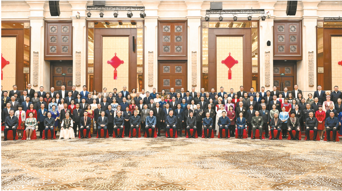
九月二十三日午，中共中央总书记、国家主席、中央军委主席习近平在乌鲁木齐亲切接见新疆各族各界代表，并同大家合影留念。