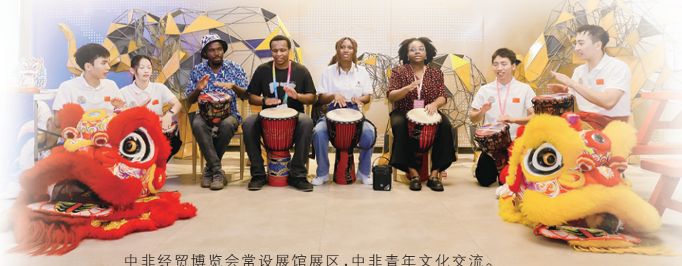
中非经贸博览会常设展馆展区，中非青年文化交流。