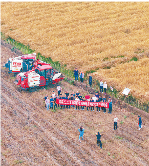
5月16日,南县2025年油菜机收减损暨田间实收测产现场会在浪拔湖镇牧鹿湖村举行。

公园建设相结合,通过在城市“开天窗”的方式保留了400余亩农田,让“人在公园走,鸟在林中飞,满目田园景”在大泽湖成为常态。 如今,这里已种上70亩水稻,并穿插种植油菜、荞麦、玉米等经济作物和紫云英、向日葵等观赏植物,配合彩虹桥、稻草人、气球飞屋等艺术装置、互动设施,打造市民游客拍照打卡点,后续还将引入农耕体验、劳动教育等研学项目。 公园于2023年初启动项目建设,在2024年底已完成基础设施建设,如今正抢抓晴好天气进行设施设备安装、广场地面铺装、廊道装饰装修、园林绿化等扫尾工程,每天现场有近千名工人、上百台机械设备忙碌运作,为推动公园如期与广大市民正式见面“加速跑”。