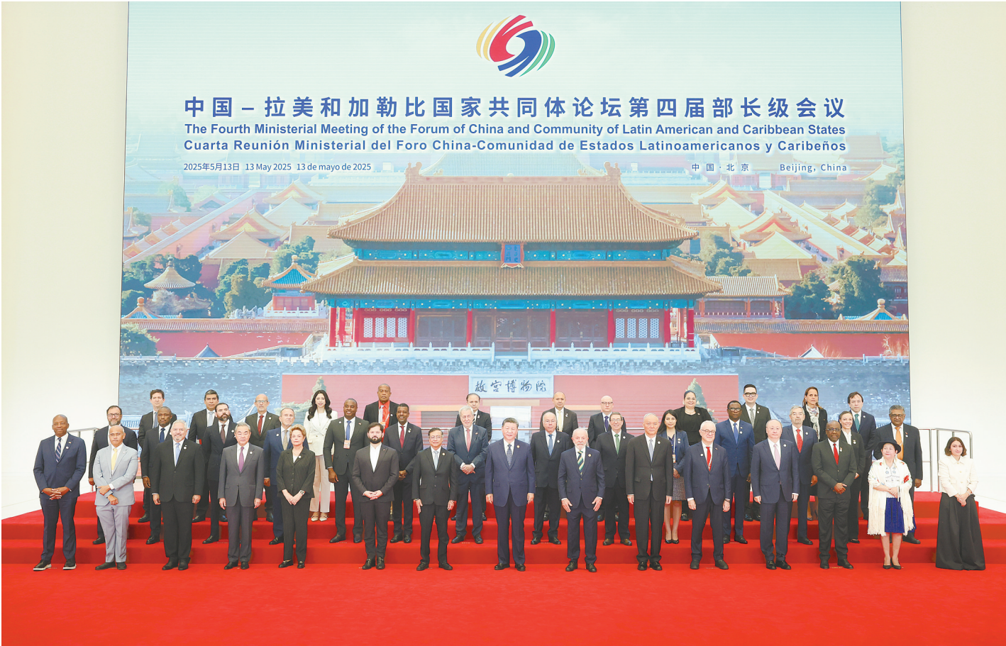
5月13日上午,国家主席习近平在北京国家会议中心出席中国—拉美和加勒比国家共同体论坛第四届部长级会议开幕式并发表主旨讲话。这是习近平同与会嘉宾集体合影。

新华社北京5月13日电 5月13日上午,国家主席习近平在国家会议中心出席中国—拉美和加勒比国家共同体论坛第四届部长级会议开幕式并发表主旨讲话。习近平宣布,中方同拉方携手启动五大工程,共谋发展振兴,共建中拉命运共同体。 初夏时节,生机盎然。国家会议中心内,中国、拉美和加勒比国家国旗以及有关地区组织旗帜交相辉映。 习近平同拉方轮值主席国哥伦比亚总统佩特罗、巴西总统卢拉、智利总统博里奇、拉美和加勒比国家以及地区组织代表团团长亲切握手并集体合影。 在热烈的掌声中,习近平发表题为《谱写构建中拉命运共同体新篇章》的主旨讲话。 习近平指出,2015年,我同拉美和加勒比国家代表一道,在北京出席中拉论坛首届部长级会议开幕式,宣告中拉论坛成立。10年来,在双方精心培育下,中拉论坛已经从一棵稚嫩幼苗