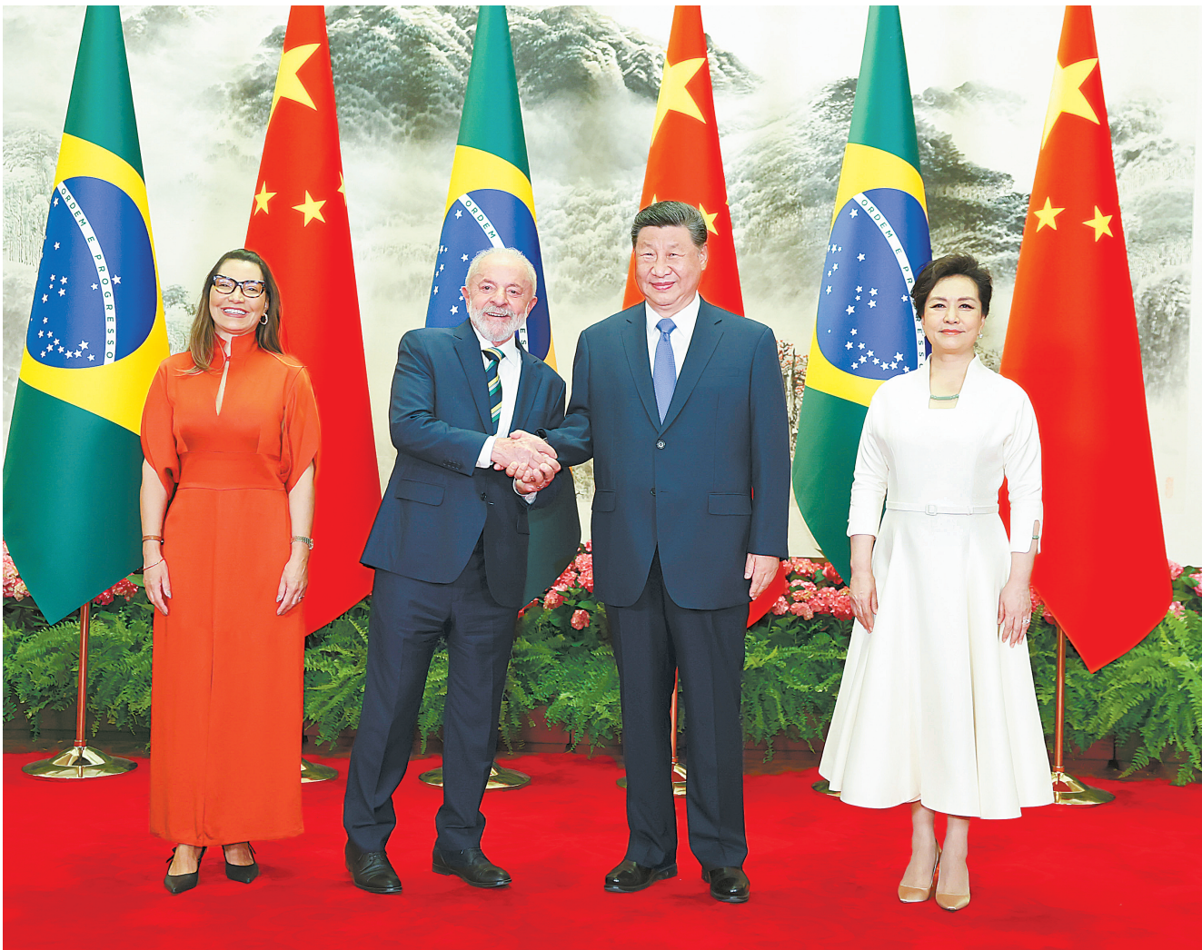
5月13日下午,国家主席习近平在北京人民大会堂同来华进行国事访问的巴西总统卢拉举行会谈。这是习近平和夫人彭丽媛同卢拉和夫人罗桑热拉合影。

新华社北京5月13日电 5月13日下午,国家主席习近平在北京人民大会堂同来华进行国事访问的巴西总统卢拉举行会谈。 习近平指出,去年中巴建交50周年之际,双方共同宣布将两国关系提升为携手构建更公正世界和更可持续星球的中巴命运共同体,这一战略决策为中巴关系下一个“黄金50年”擘画了宏伟蓝图。面对变幻莫测的国际形势,中巴两国要秉持为人类进步担当、为全球发展尽责的初心,深入推进中巴命运共同体建设,不断深化发展战略对接,携手带动全球南方国家加强团结协作。 习近平强调,站在新的历史起点,中巴双方要坚持战略互信,夯实中巴命运共同体根基,秉持相互尊重、互利共赢的优良传统,在涉及对方核心利益和重大关切问题上相互支持,加强各层级、全方位往来,确保双边关系长期健康稳定发展。要坚持扩大合作,丰富中巴命运共同体内涵,深化“一带一路”倡议同巴西发展战略有效对接,发挥好两国各项合作机制作用,加强基础设施、农业、能源等传统领域合作,拓展能源转型、航空航天、数字经济、人工智能等合作新领域,为两国务实合作打造更多亮点。要坚持人文交流,增加中巴命运共同体活力,以明年举办“中巴文化年”为契机,加强文化、教育、旅游、媒体、地方等合作,为双方人员往来提供更多便利。要坚持多边协作,提升中巴命运共同体成色。作为东西半球两大发展中国家,两国要加强在联合国、金砖国家、中拉论坛等多边机制中的协调配合,共同坚持多边主义、完善全球治理、维护国际经贸秩序,旗帜鲜明反对单边主义、保护主义和霸凌行径。 卢拉表示,巴中相互尊重,命运与共,两国关系坚不可摧,不容任何外部因素