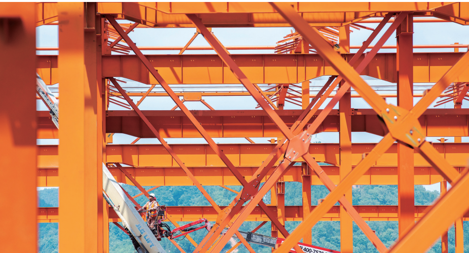
5月5日,娄底经开区,涟钢福然德新能源汽车零部件制造项目现场,建设者坚守岗位赶进度,确保按时完成项目建设。

“五一”期间,南岳区所有国有停车场、机关单位、学校停车位免费开放,并开辟景区专线,推出免费接驳、百万文旅消费券等便民措施。在景区售票处、交通要道等游客密集区域,设置了便民服务点和志愿服务岗,志愿者身着统一的“红马甲”,为游客提供免费茶水、旅游咨询、路线引导等服务。