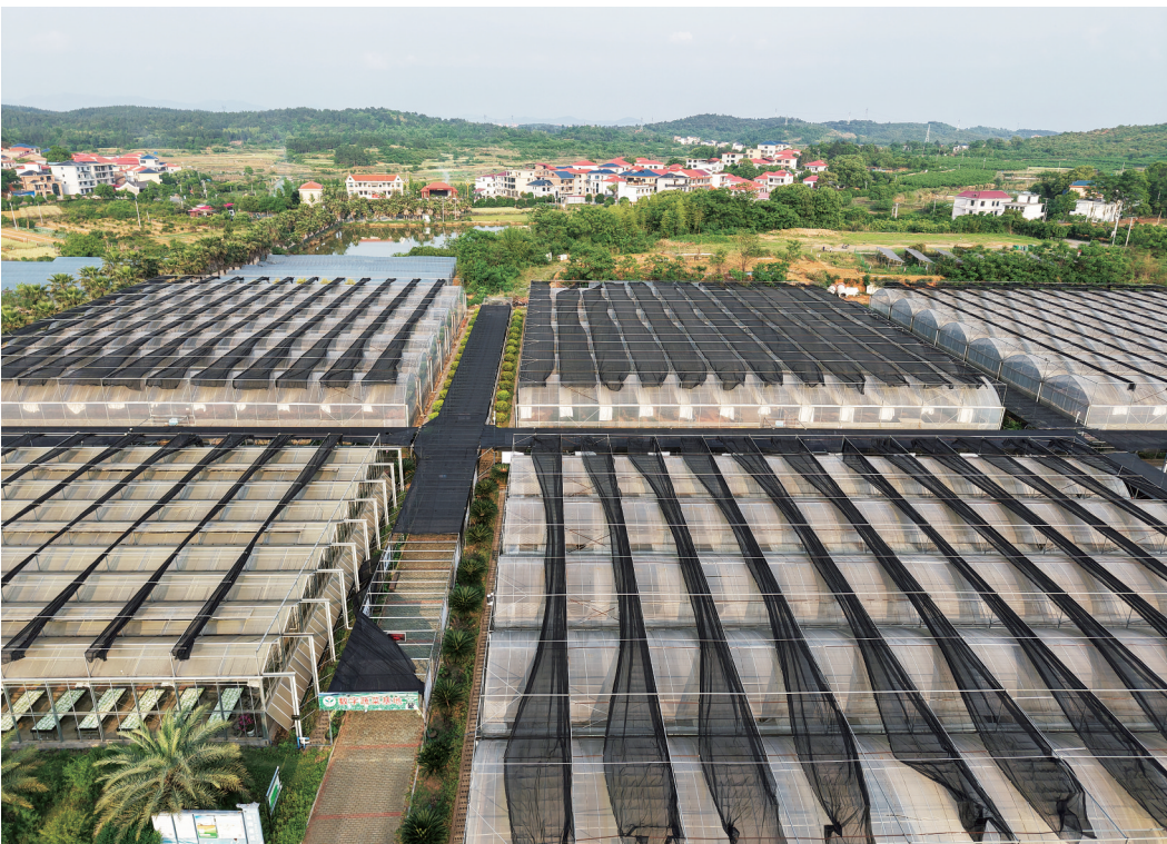
祁阳市茅竹镇三家村。(资料照片)

“三家村的成功实践,让我们看到了农文旅融合发展的前景。”祁阳市主要领导介绍,该市因势利导,鼓励具备条件的乡村发展农文旅融合产业,以农促文旅、以文旅兴农。目前,该市已有3个农文旅融合景区,创建为国家3A级景区。与此同时,