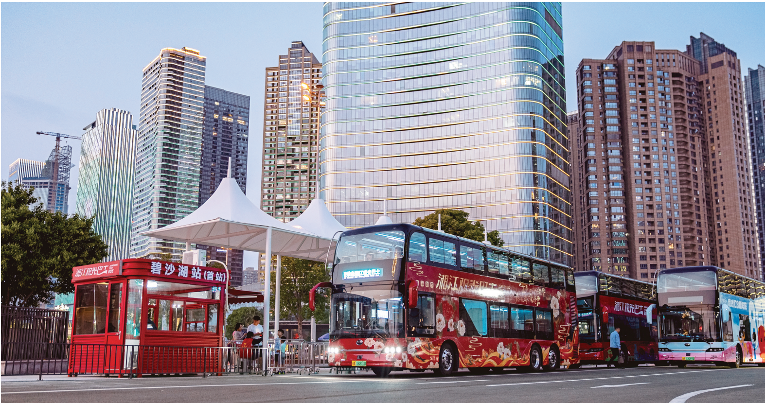
5月5日，长沙市天心区碧沙湖停车场，湘江观光巴士即将发车。“五一”假期，湖南文旅市场火热。