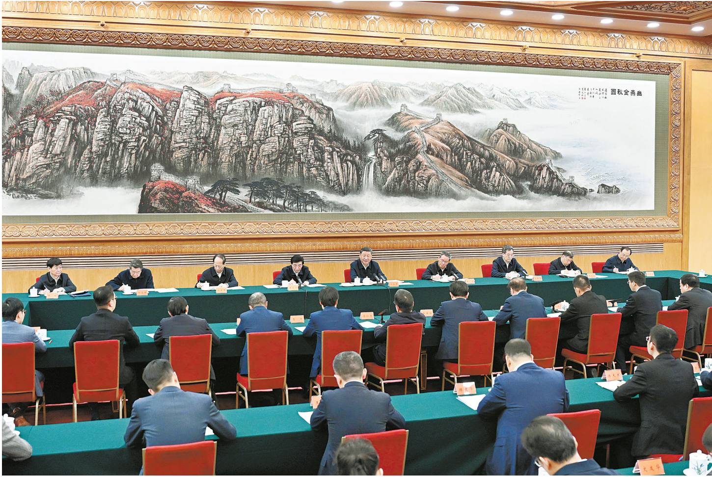
2月17日，中共中央总书记、国家主席、中央军委主席习近平在京出席民营企业座谈会并发表重要讲话。

习近平指出，现在我国民营经济已经形成相当的规模、占有很重的分量，推动民营经济高质量发展具备坚实基础。新时代新征程，我国社会生产力将不断跃升，人民生活水平将稳步提高，改革开放将进一步全面深化，特别是教育科技事业快速发展，人才队伍