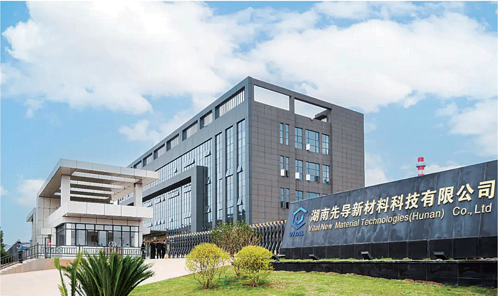
湖南先导新材料科技有限公司。