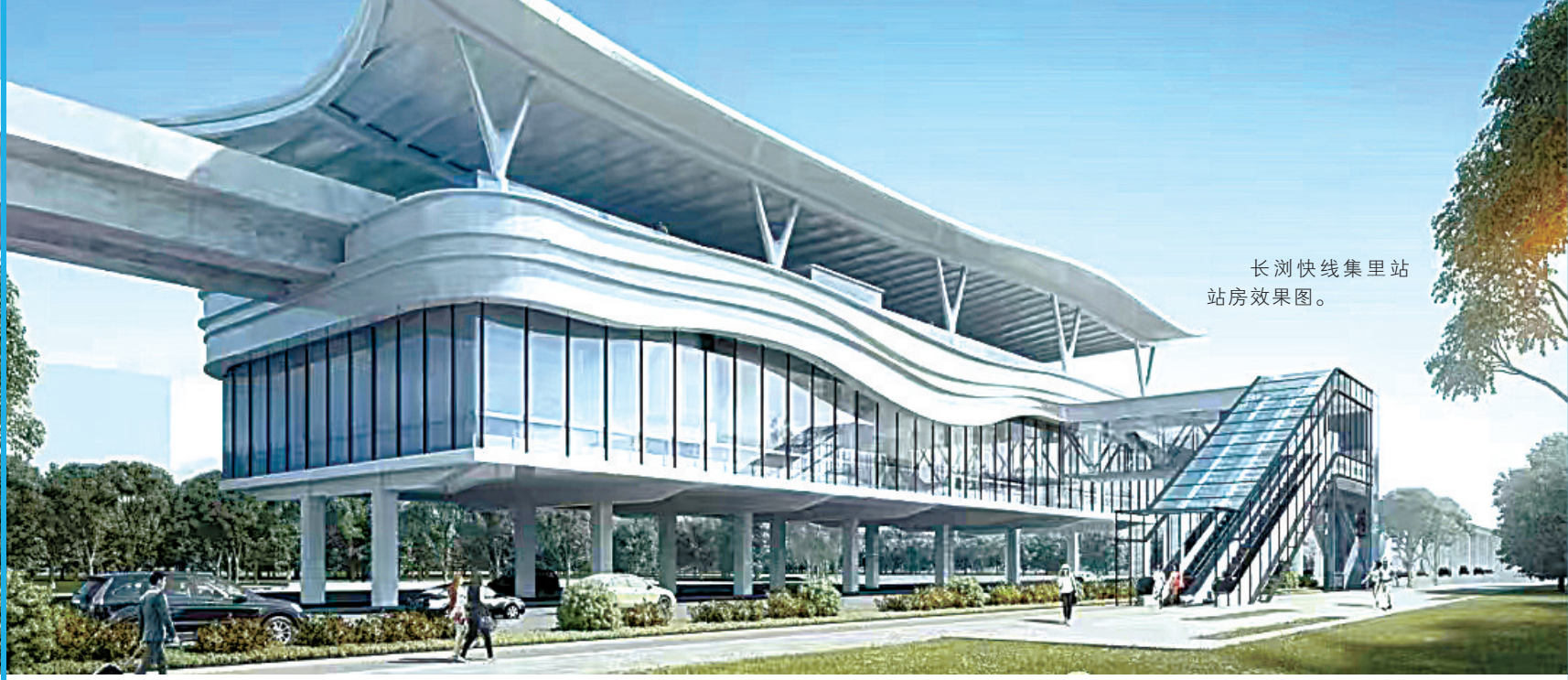
长浏快线集里站 站房效果图。