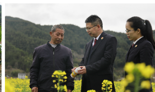
桂东县检察院的检察官在田间地头宣讲农药、化肥包装废弃物处理方法。