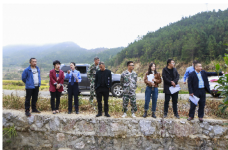
临武县检察院邀请人民监督员、人大常委会和相关行政机关负责人到水源地查看整改效果。