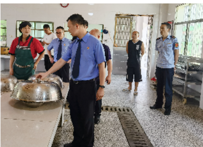
永兴县检察院应邀参加并监督该县市场监督管理部门开展的校园食品安全检查行动。