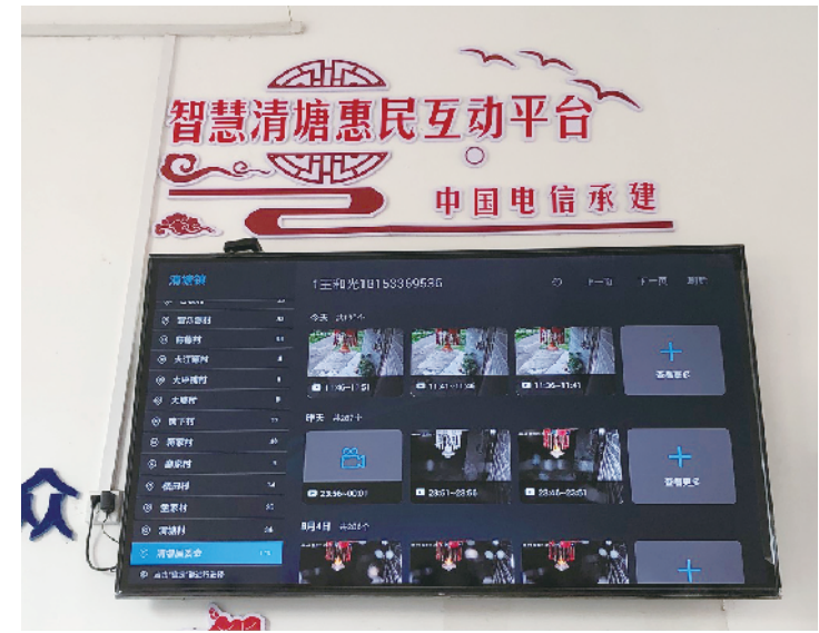
“户户通”平台监控指挥中心。

所盼，并发现了痛点所在——由于当下农村青壮年大都外出务工，家中都是留守老人、妇女、儿童，如何保障他们的人身、财产安全，成了目前困扰农村群众的很大一个难题。