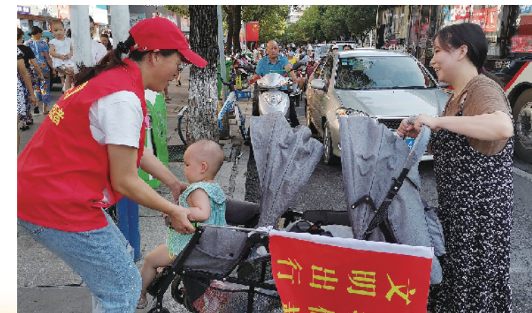
志愿者在街头开展志愿活动。

除了关爱与陪伴，志愿者们的“保护行动”也在进行。暑假期间，道县青年志愿者协会联合蓝天救援队和山地救援队两大志愿服务组织，在道县东门街道、上关街道、梅花镇、寿雁镇等地开展了防溺水志愿服务活动，志愿者们到社区、乡镇，为当地干部职工以及巡逻安全员、儿童尤其是留守儿童，提供防溺水的知识培训和自护救援培训。救援队还选择3个重点水域开展巡河志愿服务活动，并利用无人机扩大巡逻范围，及时劝阻青少年私自下河游泳。