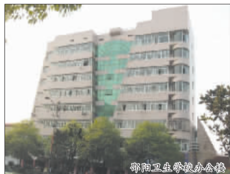
邵阳卫生学校办公楼