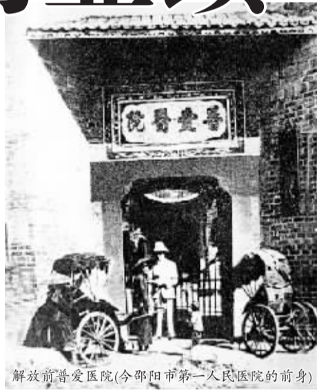
解放前普爱医院(今邵阳市第一人民医院的前身)

1974 年邵阳开始了对农村的改井、改厕所活动。2008 年全市农村改水累计受益 571.05 万人,受益率 92.01%;其中自来水受益 340.15 万人,受益率达 54.78%。累计改厕 70.21 万户,卫生厕所普及率达 39.57%。2009 年 1 月邵阳市实现创建“湖南省卫生城市”目标。