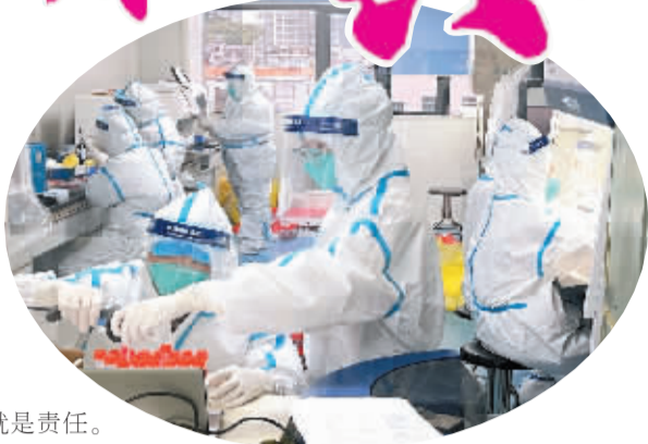
忙碌的核酸检测人。

娄底是“蚩尤故里，湘中明珠”，素有“中华武术之乡”“中华女杰之乡”“中华诗词之乡”之称。总面积8117平方公里，辖1区、2市、2县，总人口约450万人。近年来，娄底市疾病预防控制中心坚持以人民健康为中心，以建设“健康娄底”为目标，凝心聚力、铁肩担责，全面落实重大疾病防控措施，努力提升传染病防控水平，扎实开展各项疾病防控工作，切实筑牢疫情防控防线，为人民幸福筑牢健康屏障，取得了令人瞩目的优异成绩。先后荣获“全国文明单位”“湖南省卫生应急突出贡献集体”“湖南省环境与健康工作先进集体”“湖南省突发公共卫生事件和传染病信息报告管理工作先进集体”“湖南省抗击新冠肺炎疫情先进集体”“娄底市五一劳动奖”等荣誉称号。