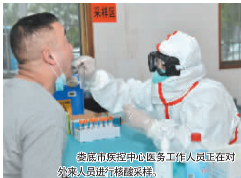
娄底市疾控中心医务工作人员正在对外来人员进行核酸采样。

自新冠疫情发生以来，娄底市疾控中心全体干部职工勠力同心、勇挑重担，攻坚克难、负重前行，白衣执甲、夜以继日，为娄底人民的生命安全和身体健康筑起了坚不可摧的“堡垒”与“防护墙”。