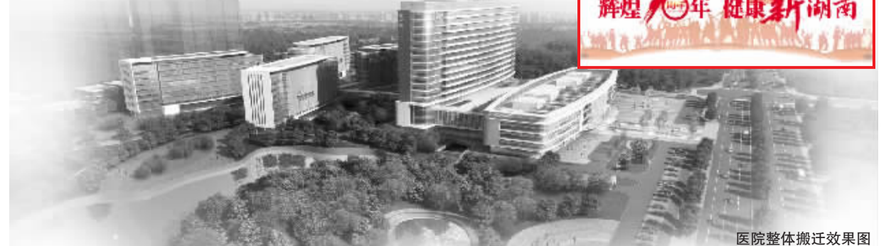
医院整体搬迁效果图