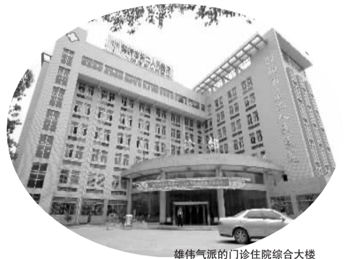
雄伟气派的门诊住院综合大楼

千年宝庆，资江北去，巍巍东塔，惟楚有材。半个多世纪的励精图治，邵阳市第二人民医院将一个资产不足300万元千打垒的简陋诊所，打造成拥有固定资产1.8亿元、年收入1.9亿元的大型现代化综合医院。尤为可喜的是，从1978年到2019年，邵阳市第二人民医院乘改革开放的春风，风雨兼程，开拓创新，以仁者之心，厚泽载物，用精湛的医术，守候一方百姓的安康，缔造了一个又一个医者传奇。