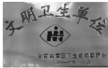
荣获“省文明卫生单位”荣誉称号

2001年，该院以百姓期盼和需求为总目标，自觉强化公益与服务属性，精心打造品牌医院“平民化价格”，在全市首开限额收费先河，在妇产科和外科推出单病种限价等惠民改革，同时切