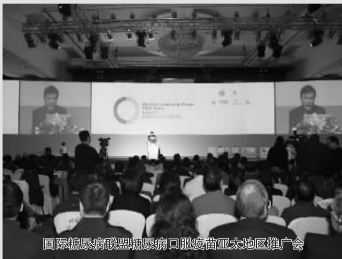
国际糖尿病联盟糖尿病口服疫苗亚太地区推广会

如若您或亲友是糖尿病患者,请尽快拨打口服疫苗咨询电话 400-705-1619 您的健康将会因此而改变!前100名打进电话者有特大惊喜,还可享受特 IDF 的特别救助!