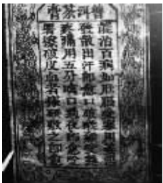
故宫内百年普洱茶膏碑文

建国后,普洱茶膏被列入国家中药重点保护项目,清代御医陈贺题写的百年碑文在故宫内存放至今。而神九搭载返回的普洱茶叶正是“茶膏”专用普洱茶叶。