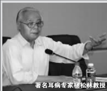
著名耳病专家杨松林教授

杨教授点评：患者难忍耳鸣耳聋之苦，盲目使用一些非正规药品、保健品，不对症，必然是病越治越重，还浪费钱财。治耳鸣耳聋须一要药品是否有正规批准文号，二要对症看药品功能主治。国药准字Z20043238新一代耳病专用药杨教授【益气聪明丸】，强效修复耳神经，调理脏腑功能，按疗程服用就能轻松治好耳病。