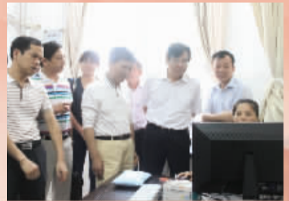
省卫生厅厅长张健到湘潭调研