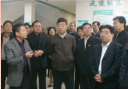
省委常委、常务副省长于来山视察湘潭卫生工作