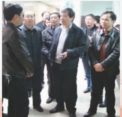
省卫生厅党组书记肖策群到湘潭调研